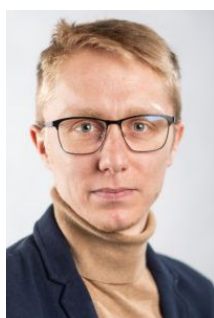
pracownik Biura Informacji i Promocji WNPiD